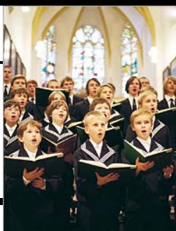
Chlapecký sbor Thomanerchor