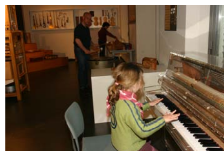
Zvuková laboratoř v Muzeu hudebních nástrojů v Lipsku

Krátce řečeno, v Lipsku je toho k vidění tolik, že se to snad ani za jeden den stihnout nedá... Nevadí,