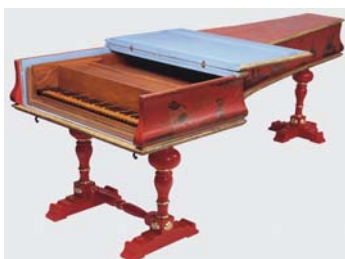
Nejstarší klavířový klavír na světě od B. Cristoforiniho z roku 1726

Adresa: Museen im GRASSI Museum für Musikinstrumente Johannisplatz 5 - 11 04103 Leipzig